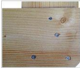
Toppbord- venstre hjørnekloss