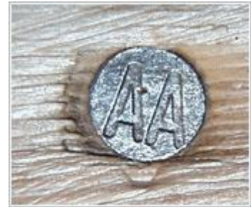
Spikerhode med to bokstaver